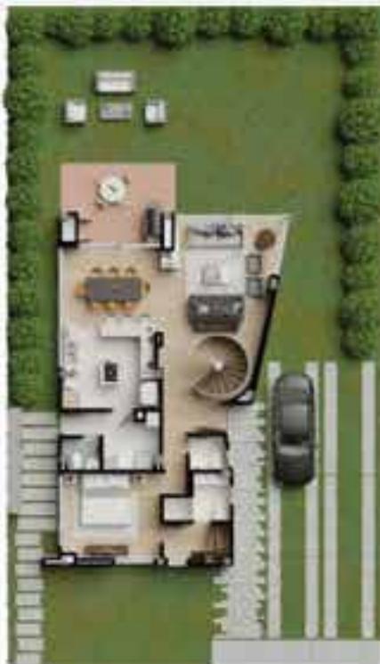
OPCIÓN 3 DEL PISO 1