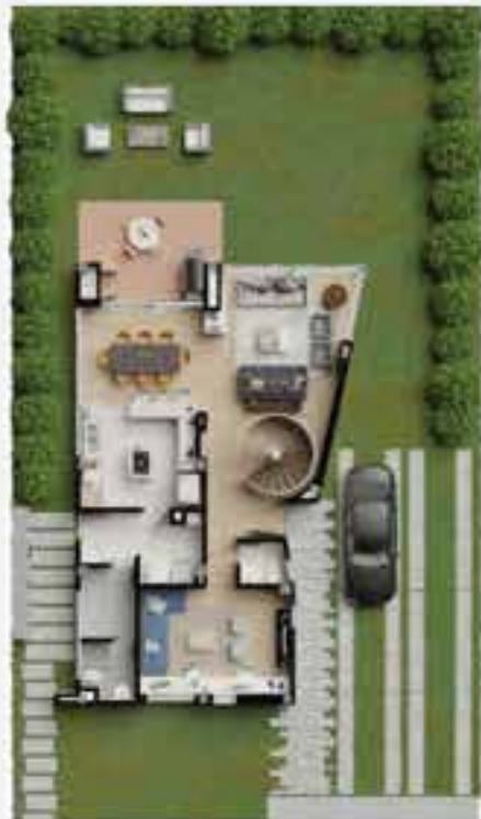
OPCIÓN 2 DEL PISO 1